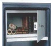
Equipements intérieurs (en partant de la gauche) : tablette, armoire à clé