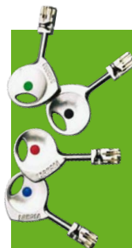
Cylindre 787 Z

Nos produits sont garantis 10 ans. Voir conditions auprès de votre Point Fort Fichet ou sur notre site www.fichet-pointfort.com